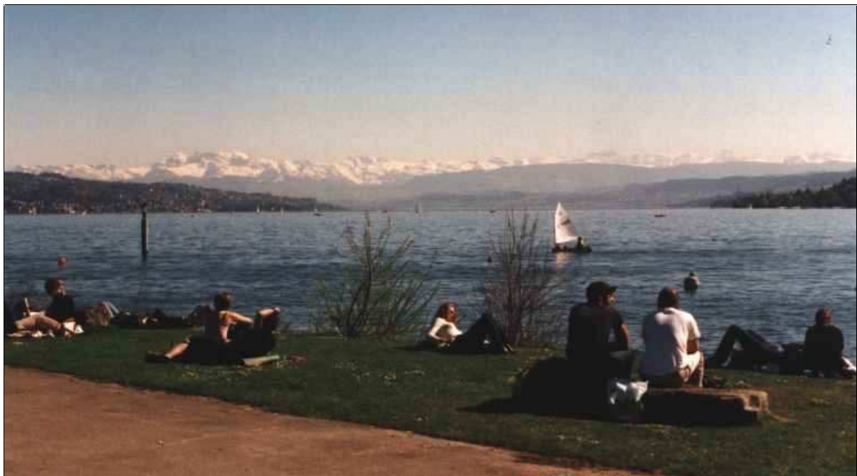
Blick über den Zürichsee

So waren die ersten Tage in Zürich, als ich Anfang April hier ankam: herrliches Wetter, warm und tolle Sicht (und ich bin die meiste Zeit auf Wohnungssuche durch Zürich gekurkt und hatte tierisch Heuschnupfen).