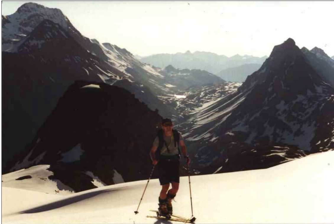
Aufstieg zum K2, im Hintergrund der Albula-Pass

Ich war dann schon ein bißchen demotiviert und frustriert, was ich allerdings meistens bin, wenn ich nachts um 2:45 Uhr aufstehen muß. Nach diesem anfänglichen Schock sind wir dann trotzdem losgezogen und haben auch ziemlich schnell Schnee gefunden, so daß wir die Ski anschnallen konnten.