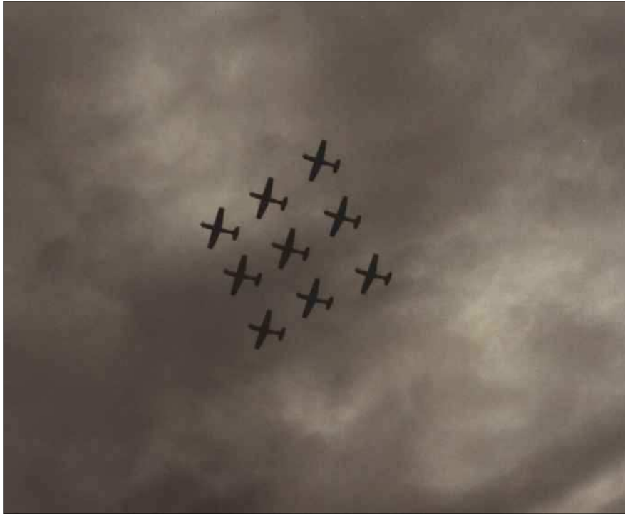
Formationsflug über dem Zürichsee

Am meisten haben mich aber die unglaublich vielen Leute beeindruckt. Die Straßen waren wirklich randvoll. Als wir uns einen guten Platz zum Feuerwerk angucken suchen wollten, sind wir auf der Rathausbrücke wirklich einfach stecken geblieben - nichts ging mehr. Witzig war noch, wie sich innerhalb dieser Menschenmassen auf den Straßen dann doch "Strömungen" herausgebildet haben. Das sah von oben zum Teil recht lustig aus, wie sich so die einzelnen "Strömungen" in verschiedenen Richtungen aneinander vorbei bewegt haben. Gegen 4:00 Uhr bin ich dann langsam nach Hause gegangen und es waren in der Innenstadt immer noch unheimlich viele Leute unterwegs - die Straßen waren noch richtig voll (auch mit unheimlich viel Müll allerdings).