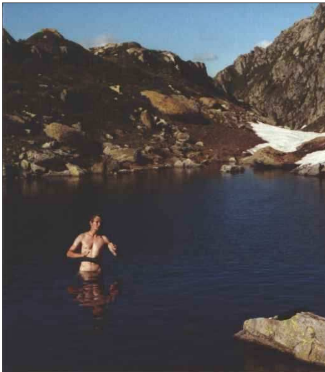
abendliches Bad im See bei Hütte

Nachdem am Donnerstag Abend der Bericht dann endlich fertig und abgegeben war, haben wir uns mal ein bißchen intensiver mit den Alkoholvorräten in der Hütte befaßt. Allerdings war zu diesem Zeitpunkt das Bier schon seit 2 Tagen alle, so daß uns nur der Wein blieb. Den Weinvorrat haben wir dann auch noch ziemlich dezimiert. Es war noch ein ziemlich lustiger Abend (Ja, auch die Schweizer können lustig sein!) mit viel Wein (kaum Weib->Frauen sind auch in der Schweiz in der Geologie Mangelware) und Gesang, wobei das Wort Abend nicht so genau zu nehmen ist, denn ich bin erst ca. 4:30 Uhr schlafen gegangen. Das Aufstehen kurz danach viel dann ziemlich schwer, aber es war ja dann nur noch Hütte aufräumen, Abstieg und Rückfahrt nach Zürich angesagt. Der Hüttenwart (kommt anscheinend nur zum Wochenende hoch) hat angeblich ziemlich geflucht, als er auf der Hütte angekommen ist und kein Bier da war. Anscheinend haben wir so ziemlich den ganzen Alkoholvorrat vernichtet, der eigentlich für den gesamten Sommer gedacht war.