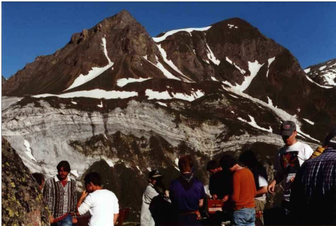
Blick von der Hütte auf die gegenüberliegende Talseite mit toller Falte kurz vor dem allgemeinen morgendlichen Aufbruch

Am ersten Tag, das heißt beim Aufstieg zur Hütte, gab es eine kurze Einführungsexkursion. Kartiert wurde zu zweit. Es wurde nicht jeder Gruppe genau ein Gebiet zugeteilt, sondern es wurde gesagt innerhalb welches größeren Gebietes kartiert werden soll/darf und den Ausschnitt an sich, den man daraus kartieren will, konnte man selbst festlegen. Insgesamt waren wir so ungefähr 10 Gruppen und unverhältnismäßig viele Betreuer (2 Profs. und jede Menge Assistenten, zumeist Doktoranden), so daß fast auf jede Gruppe ein Betreuer kam. Wollte man einen mitnehmen, dann hat man sich auf einer Liste bei dem Betreuer seiner Wahl bzw. bei dem, der noch frei war, eingetragen und die sind dann mitgekommen. Zu kartieren gab es tolle metamorphe Gesteine und jede Menge Strukturen, wie man ja anhand des Fotos von der Falte schon sehen kann.