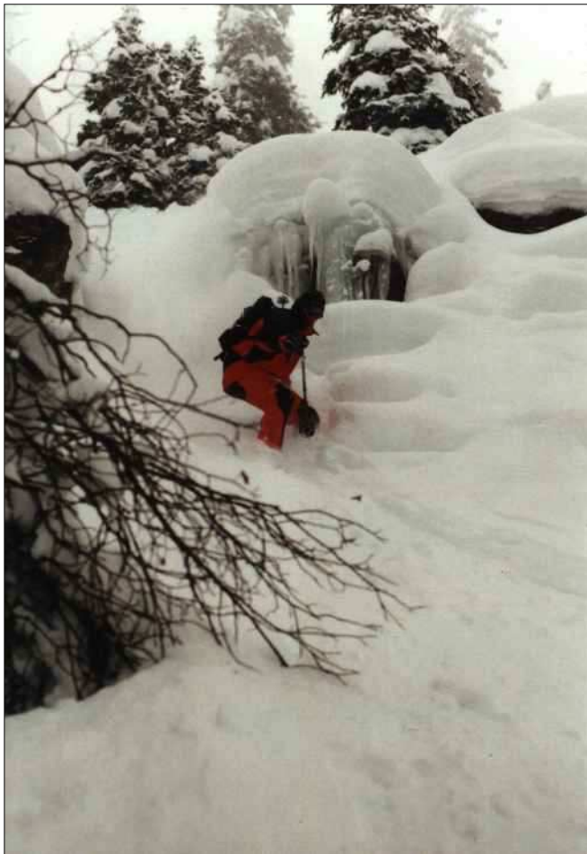
... und Norbert kämpft sich durch die Rinne