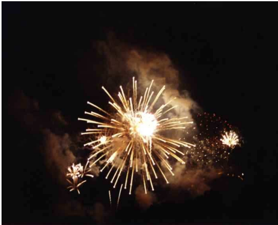
Feuerwerk am Zürifäscht

Freitag nachmittag habe ich mich dann erstmal auf die Couch geknallt und ein bißchen geruht. Bin dann allerdings nachts nochmal in die Stadt reingefahren, da ja gerade Zürifäscht war. Dabei handelt es sich um ein großes Volksfest, was wohl bloß alle 3 oder 4 Jahre stattfindet. Das ging von Freitag nachmittag bis Sonntag nachmittag (6./7./8.7.) und spielte sich wirklich in der gesamten Innenstadt ab. Insgesamt waren wohl jeden Tag so eine knappe halbe Million Leute unterwegs (Zürich selbst hat 350000 Einwohner) und gekostet hat das ganze 5,5 Millionen CHF. Davon gingen alleine schon 500000 CHF für 2 große Feuerwerke drauf, die über dem See von mehren Booten aus abgeschossen wurden. Eines war am Freitag zu Popmusik und eines am Sonnabend zu klassischer Musik.