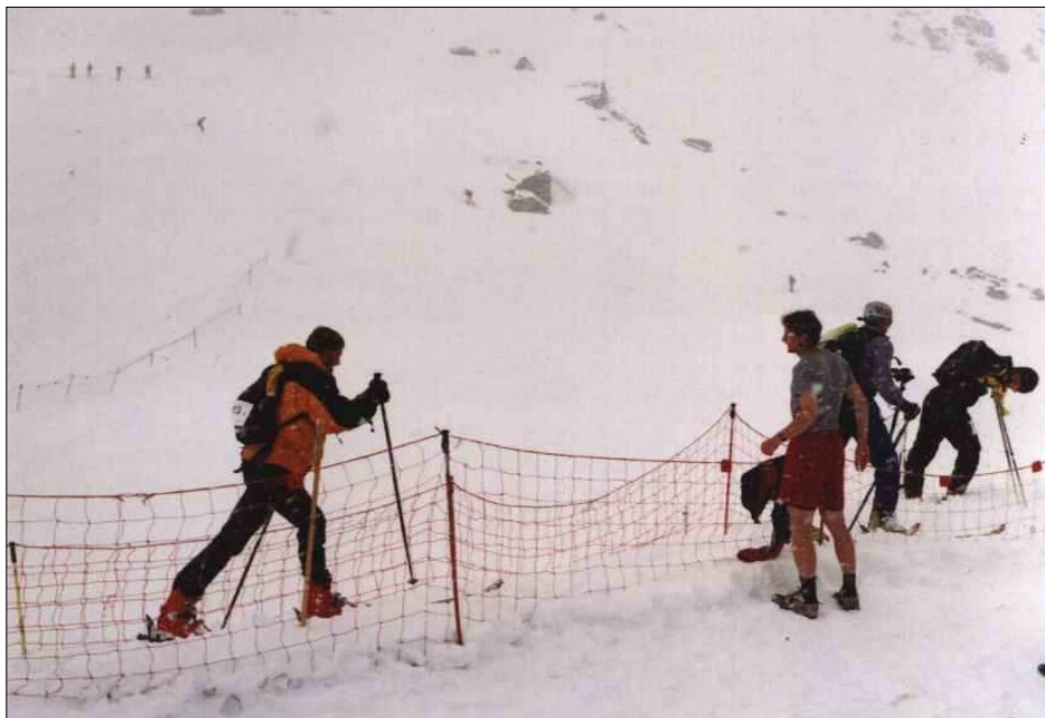
Übergabe vom Skitourengänger auf den Talläufer an der Grialetschhütte bei mächtigem Schneegestöber

Als nächstes Highlight stand dann 2 Wochen später (am 17.6.) die Grialetschstafette auf dem Programm. Das ist ein Staffel-Rennen einmal um dem Piz Grialetsch herum (eigentlich), bestehend aus einer Mountainbike-, einer Skitouren- und 3 Laufstrecken (Berg-, Tal- und Crosslauf). (Mehr Info unter http://www.stafette.ch ) Dieses Rennen wurde dieses Jahr zum ersten Mal offiziell durchgeführt. Letztes Jahr gab es allerdings schon mal einen Testlauf, um die Durchführbarkeit so einer Veranstaltung zu testen. Einige von den Leuten, die das Rennen mit organisieren, habe ich während meiner Davoser Zeit kennengelernt, und so habe ich damals auch schon bei der 0. Variante der Grialetschstafette mitgemacht. Ich habe sowohl letztes als auch dieses Jahr den Tallauf gemacht (4 km, 600 Höhenmeter) und auch ohne größere Blessuren überstanden. Das Wetter war auch mindestens genauso schlecht wie letztes Jahr bzw. eher noch schlechter. An der Grialetschhütte, wo ich gestartet bin, hatte es über Nacht mehr als reichlich (40 cm laut Organisatoren) Neuschnee gegeben (siehe Foto).