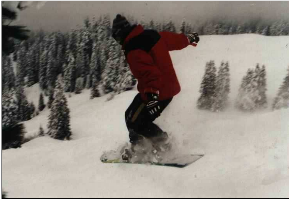
Mat fliegt durch den Pulverschnee ...